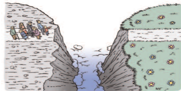
Le péché sépare l'homme de Dieu

“ Ce sont vos torts qui mettent une séparation entre vous et votre Dieu ; ce sont vos péchés qui vous cachent sa face, et l'empêchent de vous écouter. ” Esaïe 59.2